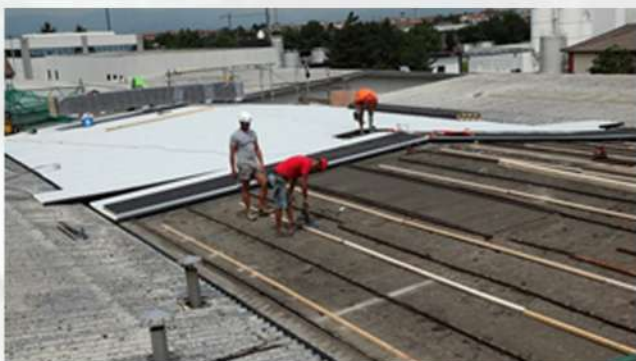
Interventi di efficientamento energetico nel settore

Tutto il personale è sanitariamente certificato per poter operare in ambienti con presenza di contaminanti. 2G Ambiente s.r.l. col suo operato unisce qualità degli interventi e continua ricerca del miglioramento del parametro costi/benefici per dare risposta alle esigenze sempre più complesse del mercato.